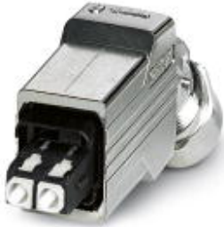
Push-pull connector (version 14), die-cast zinc, with SC-RJ insert for GOF, for cable diameter of 5.5 mm ... 10 mm, cable outlet at the bottom

Please be informed that the data shown in this PDF Document is generated from our Online Catalog. Please find the complete data in the user's documentation. Our General Terms of Use for Downloads are valid ( http://phoenixcontact.com/download )