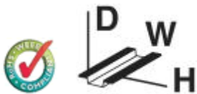
Figure shows PLC-BSC-120UC/21-21/SO46 version

14 mm PLC basic terminal block with push-in connection, without relay or solid-state relay, for mounting on DIN rail NS 35/7,5, 2 PDTs, input voltage 24 V DC