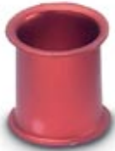
Adapter sleeve, Nominal current: 2 A, Color: pink

Please be informed that the data shown in this PDF Document is generated from our Online Catalog. Please find the complete data in the user's documentation. Our General Terms of Use for Downloads are valid ( http://phoenixcontact.com/download )