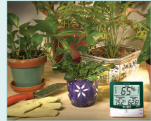
Checks the Humidity and Temperature levels for optimal plant growth in greenhouses.