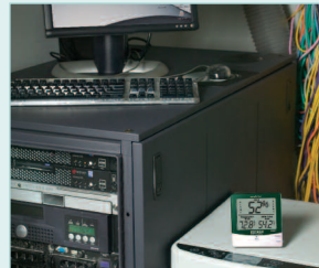
Alerts low Humidity levels in Computer rooms to help prevent electrostatic conditions.