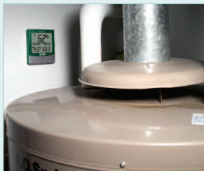
Monitoring Dew Point levels in a Basement for potential mold growth.