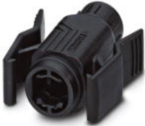
RJ45 sleeve housing, IP67, for pin insert VS-08-ST-H11-RJ45 and VS-08-ST-H21-RJ45, with push-pull interlocking for panel mounting frames, for cable cross section 5.0 mm ... 8.5 mm, color: black

Please be informed that the data shown in this PDF Document is generated from our Online Catalog. Please find the complete data in the user's documentation. Our General Terms of Use for Downloads are valid ( http://download.phoenixcontact.com )