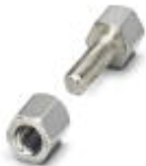
Mounting set, for DSUB gender changer contact inserts