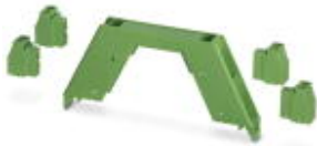
Illustration shows a fully mounted version of the electronic housing

Housing upper part, complete with PCB terminal blocks for full assembly. 8-pos., housing width: 12.5 mm