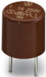
Replacement fuse, for INTERBUS-ST modules

Please be informed that the data shown in this PDF Document is generated from our Online Catalog. Please find the complete data in the user's documentation. Our General Terms of Use for Downloads are valid ( http://phoenixcontact.com/download )