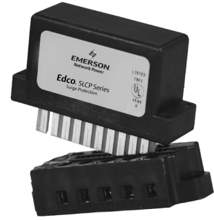
EDCO PCB1B-WKEY BASE SOLD SEPARATELY