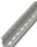
DIN rail, material: steel galvanised and passivated with a thick layer, perforated, height 15 mm, width 35 mm, length: 2000 m

DIN rail perforated - NS 35/15 PERF 2000MM - 1201730