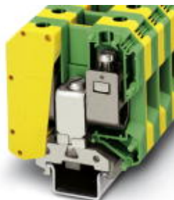
Ground modular terminal block, Connection method: Screw connection, Cross section: 16 mm 2 - 70 mm 2 , AWG 6 - 1/0, Width: 20 mm, Color: green-yellow, Mounting type: NS 35/7.5, NS 35/15, NS 32

Please be informed that the data shown in this PDF Document is generated from our Online Catalog. Please find the complete data in the user's documentation. Our General Terms of Use for Downloads are valid ( http://download.phoenixcontact.com )