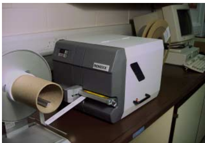
TMS 2000Plus in-line thermal transfer printer