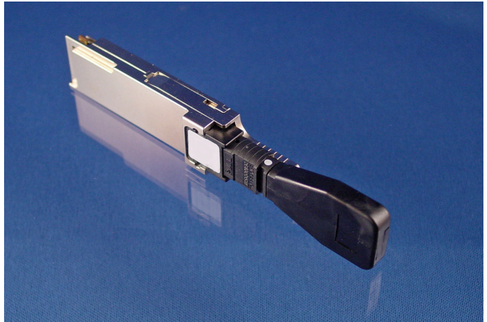
MPO Loopback with QSFP transceiver