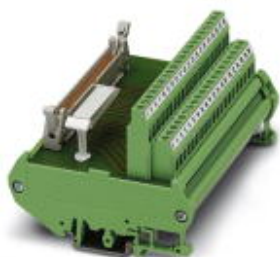
VARIOFACE interface module, for MODICON® TSX Quantum, with MODICON®-specific labeling, for I/O of 32 channels

Please be informed that the data shown in this PDF Document is generated from our Online Catalog. Please find the complete data in the user's documentation. Our General Terms of Use for Downloads are valid ( http://phoenixcontact.com/download )