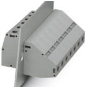
The illustration shows version HDFKV 50 in gray

Please be informed that the data shown in this PDF Document is generated from our Online Catalog. Please find the complete data in the user's documentation. Our General Terms of Use for Downloads are valid ( http://download.phoenixcontact.com )