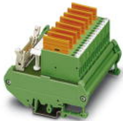
Fuse module (for analog output cards of the Delta V control system)

Please be informed that the data shown in this PDF Document is generated from our Online Catalog. Please find the complete data in the user's documentation. Our General Terms of Use for Downloads are valid ( http://phoenixcontact.com/download )