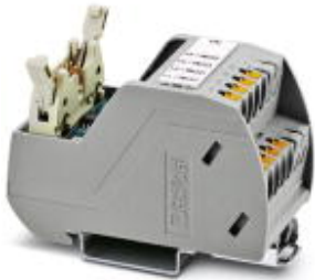
VARIOFACE Professional (VIP) board for the ROC800 controller

Please be informed that the data shown in this PDF Document is generated from our Online Catalog. Please find the complete data in the user's documentation. Our General Terms of Use for Downloads are valid ( http://phoenixcontact.com/download )