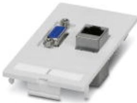
Front plate with contact inserts, plastic with shroud, 1 x RJ45, 8-pos. metal, CAT5e (socket/socket); 1 x 9-pos. D-SUB (socket/socket)

Please be informed that the data shown in this PDF Document is generated from our Online Catalog. Please find the complete data in the user's documentation. Our General Terms of Use for Downloads are valid ( http://phoenixcontact.com/download )