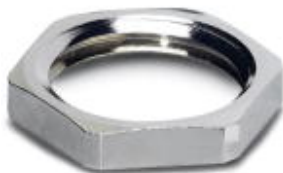
Flat nut with Pg9 thread

Please be informed that the data shown in this PDF Document is generated from our Online Catalog. Please find the complete data in the user's documentation. Our General Terms of Use for Downloads are valid ( http://download.phoenixcontact.com )