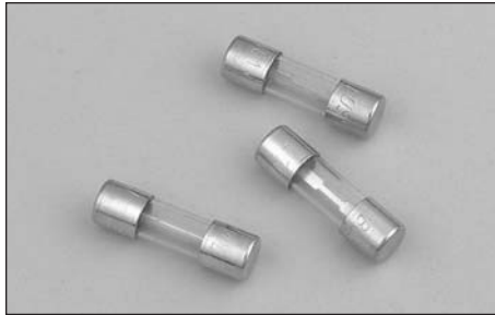
Dimensions - in