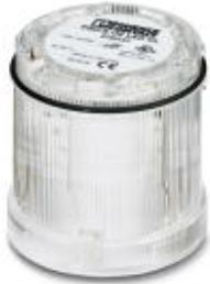
LED permanent light element, 24 V AC/DC, clear

Please be informed that the data shown in this PDF Document is generated from our Online Catalog. Please find the complete data in the user's documentation. Our General Terms of Use for Downloads are valid ( http://phoenixcontact.com/download )