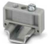
End clamp, width: 6.2 mm, color: gray