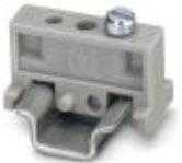
End clamp, width: 6.2 mm, color: gray