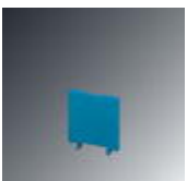
End cover, Length: 28 mm, Width: 2.5 mm, Color: blue