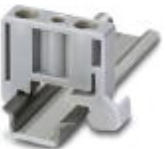
End clamp width: 6 mm, color: gray