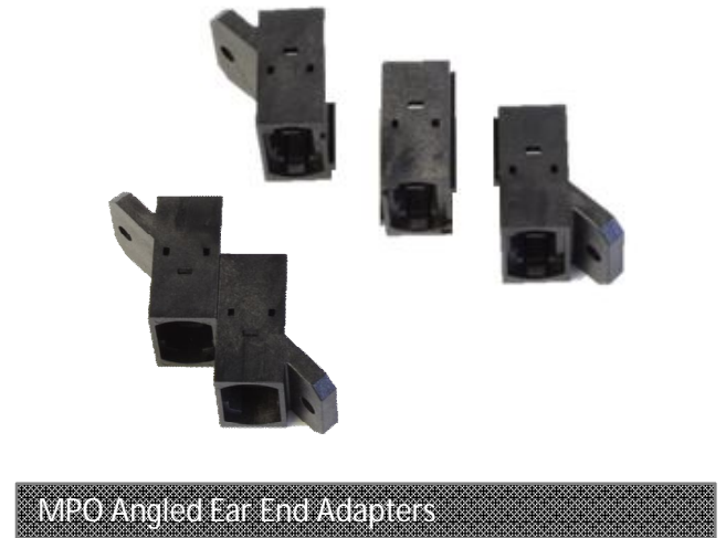
MPO Angled Ear End Adapters