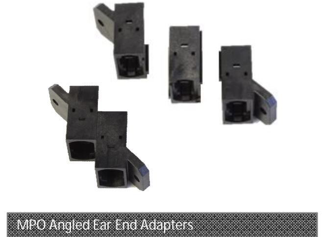
MPO Angled Ear End Adapters