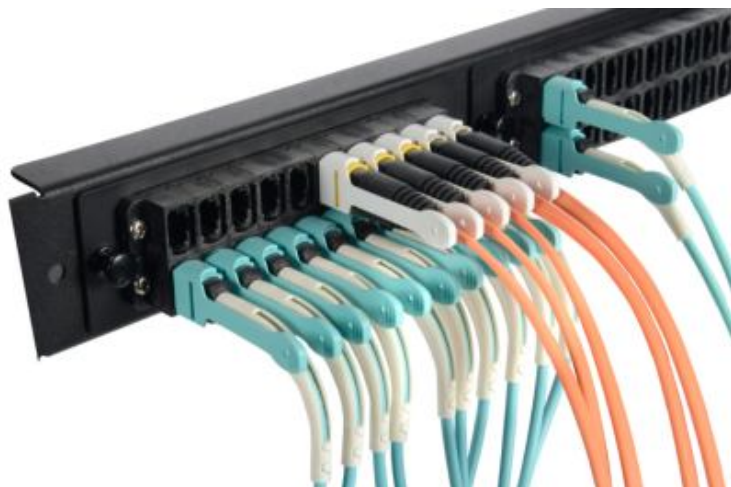
MPO Stackable Adapters w/19" Faceplate & Pull Tabs