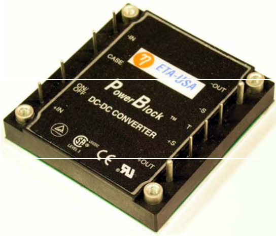
Size: 60.70mm x 57.91mm x 13.30mm (2.39in. x 2.28in. x 0.52in.)