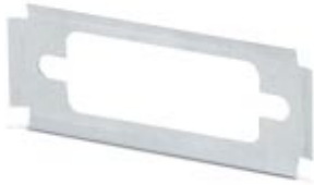
D-SUB EMC shroud, shell size 2, shielded, for panel mounting frame VS-15-...

Please be informed that the data shown in this PDF Document is generated from our Online Catalog. Please find the complete data in the user's documentation. Our General Terms of Use for Downloads are valid ( http://download.phoenixcontact.com )