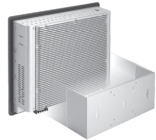
▲ Wall mounting