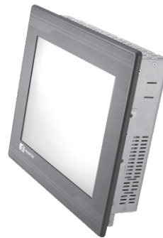
▲ Side view