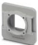
RJ45 panel mounting frame, IP67, for modular socket inserts (Keystone), for round panel cutout, with grommet, with thread and union nut, color: gray

Panel mounting frames - VS-08-A-RJ45/MOD-1-R-IP67 - 1689844