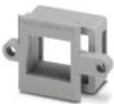
RJ45 panel mounting frame, 1x, IP20, for modular socket inserts (Keystone), without mounting screws

Panel mounting frames - VS-08-A-RJ45/MOD-1-IP20 - 1689433