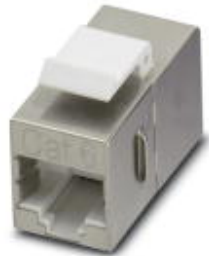
RJ45 socket insert, modular (Keystone), CAT6 (Link test), 8-position, shielded, socket on socket

Please be informed that the data shown in this PDF Document is generated from our Online Catalog. Please find the complete data in the user's documentation. Our General Terms of Use for Downloads are valid ( http://download.phoenixcontact.com )