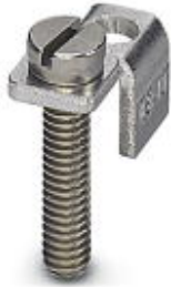
Chain bridge, Color: silver

Please be informed that the data shown in this PDF Document is generated from our Online Catalog. Please find the complete data in the user's documentation. Our General Terms of Use for Downloads are valid ( http://download.phoenixcontact.com )