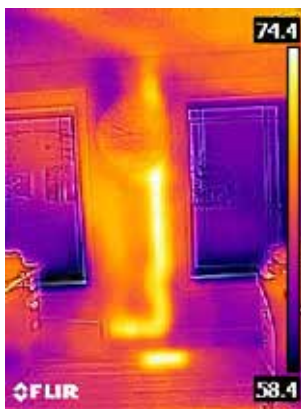
Warm drain pipe in wall