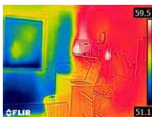
Uninsulated outside wall