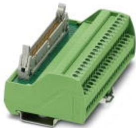
VARIOFACE interface module, for MODICON® TSX Quantum, with MODICON®-specific labeling, for I/O of 32 channels

Please be informed that the data shown in this PDF Document is generated from our Online Catalog. Please find the complete data in the user's documentation. Our General Terms of Use for Downloads are valid ( http://phoenixcontact.com/download )