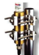
FM2 Mounting Kit (Sold separately)

Americas: +1.847.839.6925 IAS-AmericasSales@lairdtech.com