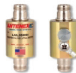
Lightning Arrestor LABH350NN (Sold Separately)