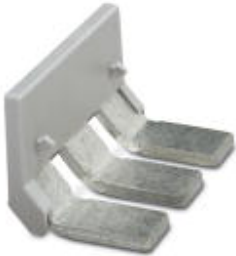
Insertion bridge, Number of positions: 3, Color: gray

Please be informed that the data shown in this PDF Document is generated from our Online Catalog. Please find the complete data in the user's documentation. Our General Terms of Use for Downloads are valid ( http://phoenixcontact.com/download )