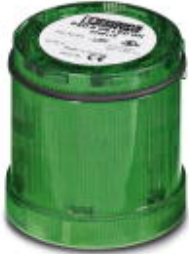
LED permanent light element, 24 V AC/DC, green

Please be informed that the data shown in this PDF Document is generated from our Online Catalog. Please find the complete data in the user's documentation. Our General Terms of Use for Downloads are valid ( http://phoenixcontact.com/download )