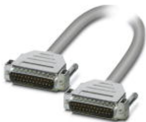
Assembled shielded round cable; connection 1: D-SUB pin strip (1x 25-position); connection 2: D-SUB pin strip (1x 25-position); cable length: 1.5 m

Please be informed that the data shown in this PDF Document is generated from our Online Catalog. Please find the complete data in the user's documentation. Our General Terms of Use for Downloads are valid ( http://phoenixcontact.com/download )