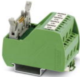
VARIOFACE Professional (VIP) module for Siemens ET200 ISP controllers

Please be informed that the data shown in this PDF Document is generated from our Online Catalog. Please find the complete data in the user's documentation. Our General Terms of Use for Downloads are valid ( http://phoenixcontact.com/download )