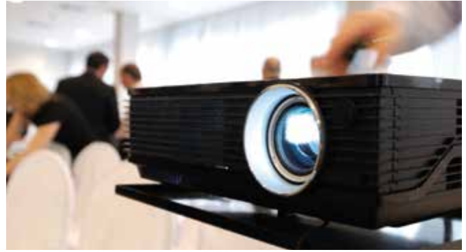
The power of simplicity: 50W blue laser light out of a single package

Unique 50W optical output power: the new laser module PLPM4 450 from OSRAM Opto Semiconductors greatly simplifies the construction of professional laser projectors. For the first time up to 20 blue laser chips have been packaged into a compact housing. In addition, the optical power of the individual chips has been doubled, thus achieving a total power of 50 watts and enabling projectors over 2,000 lumens of brightness with only one housing.