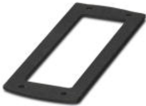
The photo shows size B16