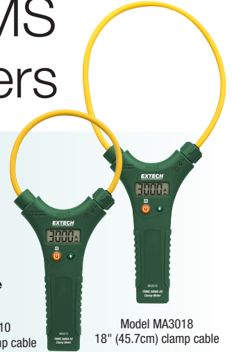
Model MA3018 18" (45.7cm) clamp cable