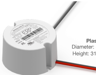
Plastic Case Diameter: 58 mm (2.28 in) Height: 31.7 mm (1.25 in)