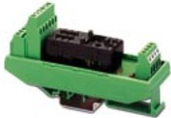
Universal module, with Hartmann & Braun plug-in base for relay 1003, contact: 3 PDT

Please be informed that the data shown in this PDF Document is generated from our Online Catalog. Please find the complete data in the user's documentation. Our General Terms of Use for Downloads are valid ( http://phoenixcontact.com/download )