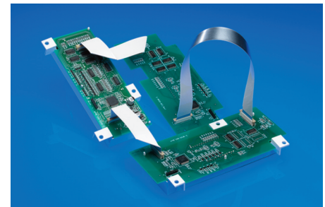
Premo-Flex™ Flat Flex Jumpers