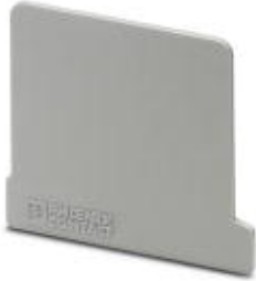
End cover, Length: 42.5 mm, Width: 1.3 mm, Color: gray

Please be informed that the data shown in this PDF Document is generated from our Online Catalog. Please find the complete data in the user's documentation. Our General Terms of Use for Downloads are valid ( http://download.phoenixcontact.com )