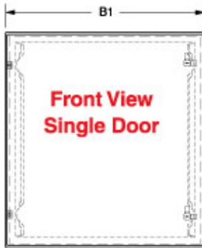
Front View Single Door