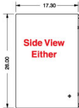
Side View Either