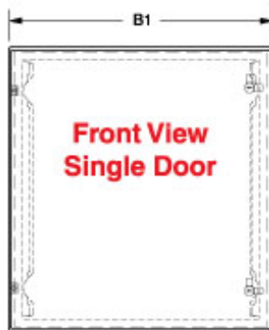
Front View Single Door