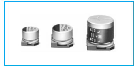
Marking color : Black print (except height : 10mm) White print on a brown sleeve (ø8x10L, ø10x10L)