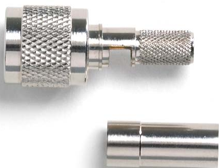
Model 73057 TNC Plug, 50 Ohm, Crimp Type, RG59, 62