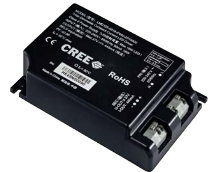
230 V Driver