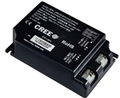
230 V Driver