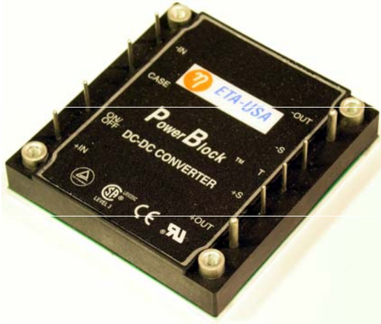
Size: 60.70mm x 57.91mm x 13.30mm (2.39in. x 2.28in. x 0.52in.)