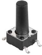
LPH: Through hole, variable height