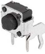
LPV: Through hole, angled