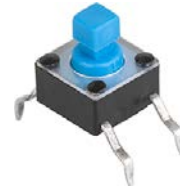
LPS: Through hole, square