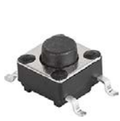
LSH: Gullwing, variable height